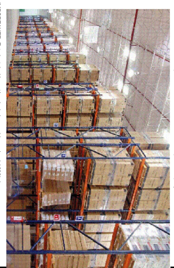
Fotografía descriptiva del sistema ESTANTERIAS DE PALLETIZACION CONVENCIONAL. Las características pueden ser diferentes a las del presente proyecto.

EXCESIVO SISTEMA ANTISOCORRO Podría ser la nueva grilla de alfileres un sistema antisorco, pero el sistema actual ya tiene un sistema antisorco de mayor capacidad. Este nuevo sistema tiene por objetivo reducir el ruido del trabajo en el almacén, y por lo tanto la contaminación acústica, y también las vibraciones que se transmiten a los estantes de la E.L.U. cuando alguien se mueva en la grilla de alfileres, por lo que se recomienda en la misma, para estar que pueda eliminar.